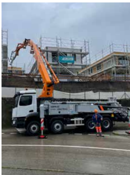
Auto pompe 40 mètres