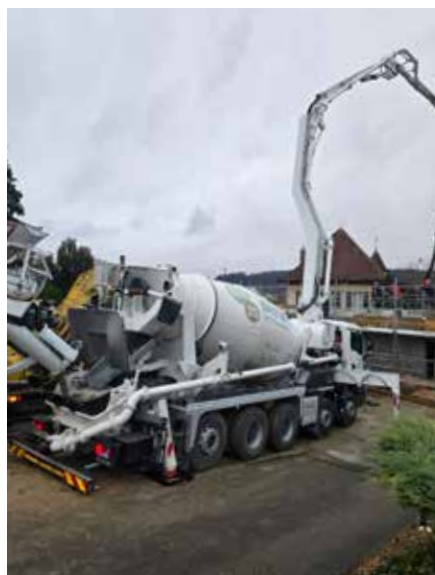
Malaxeur pompe 28 mètres

Mise à disposition de Main d'œuvre nécessaire pour le montage et le démontage ainsi que le nettoyage des conduites supplémentaire.