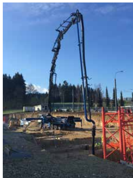
Auto pompe 47 mètres